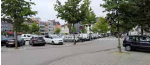
N-VA wil parkeerplaatsen markt behouden p. 2