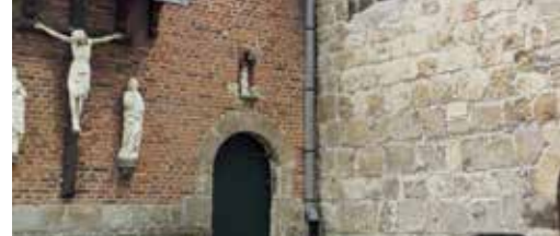
Herbestemming van onze kerken p. 3