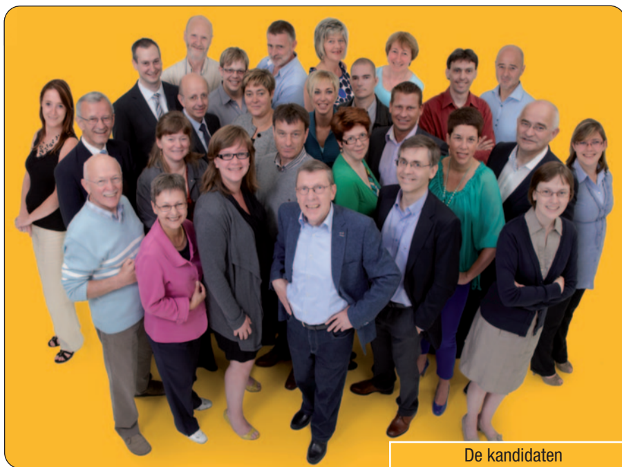
De kandidaten van N-VA Wetteren.

N-VA Wetteren verkiezingen ook op het net: Ga dus vlug een kijkje nemen naar www.n-va.be/wetteren