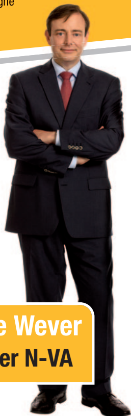
Bart De Wever Voorzitter N-VA