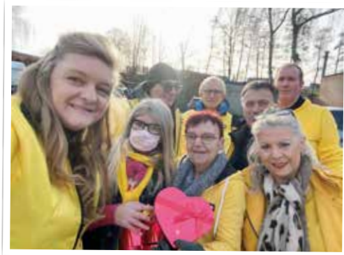
▲ Op Valentijn verrasten de Wetterse bestuursleden de bezoekers van de markt en Massemen kermis met een gelukskoekje. Na twee jaar corona konden ze wel een 'klein gelukske' gebruiken.