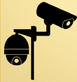
Cameraschild in en rond Wetteren