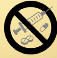
Nultolerantie tegen criminelen en drugsdealers