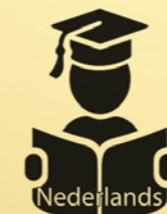
Nederlands als voertaal op school