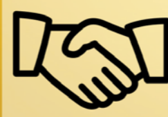
Optimale samenwerking tussen Sociaal Huis en gemeentediensten