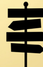
Bereikbaarheid van de middenstand rustpunten en laadpalen