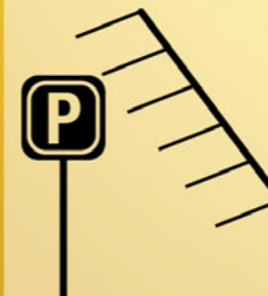
Invoering doordacht parkeerbeleid