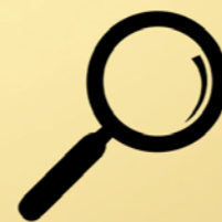
Aanpak misbruik sociale woonbeleid