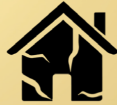
Leegstand & kraken ontmoedigen en aanpakken