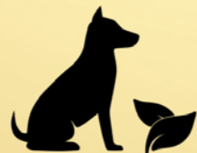
Mens en dier uitloopweides & rustpunten in het groen