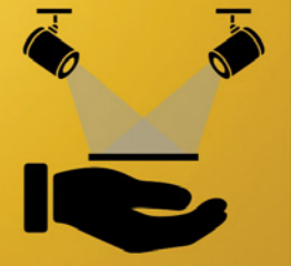
Positieve initiatieven faciliteren en ondersteunen