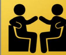
Jeugd- ontmoetingscentrum en repetitieruimte