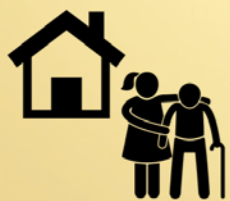
Assistentiewoningen voor onze senioren