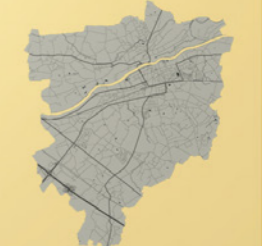
Omleiden doorgaand verkeer