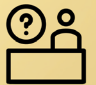
Meer ondersteuning voor de integratie-ambtenaar