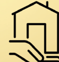
Afbouw opvang- plaatsen asielzoekers