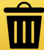
Aantrekkelijke en propere straten