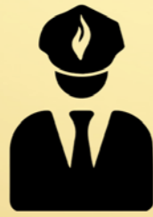
De wijkagent als spilfiguur