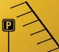
Mobiliteits- en parkeerbeleid