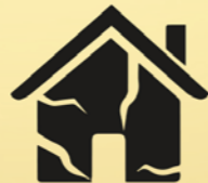
Probleemzones aanpakken door publiek- private samenwerking