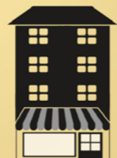
Inbreiding & stads-kernvernieuwing