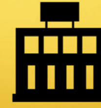
Buurthuizen efficiënt en correct gebruik