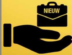
Ondernemersloket ondersteuning jonge starters