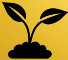
Toeristische troeven nog meer uitspelen: Schelde- planten - rozengemeente