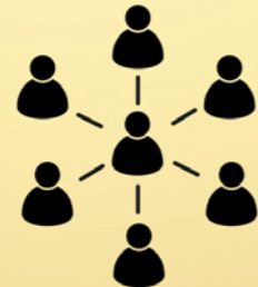
Ondersteuning BIN's (buurtinformatienetwerk)