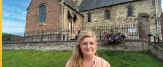
Onroerend erfgoed blijft beroeren in Westrem (p.2)