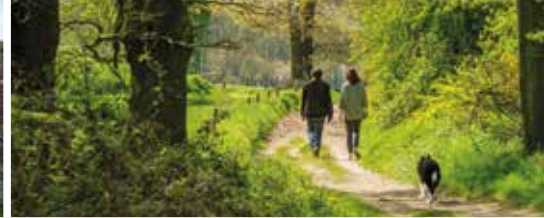
Meer aandacht voor trage wegen (p.3)